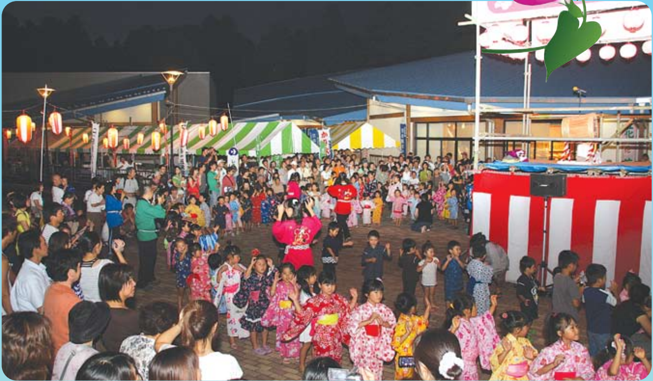
与一の郷夏祭り（大田原市）本文P.6