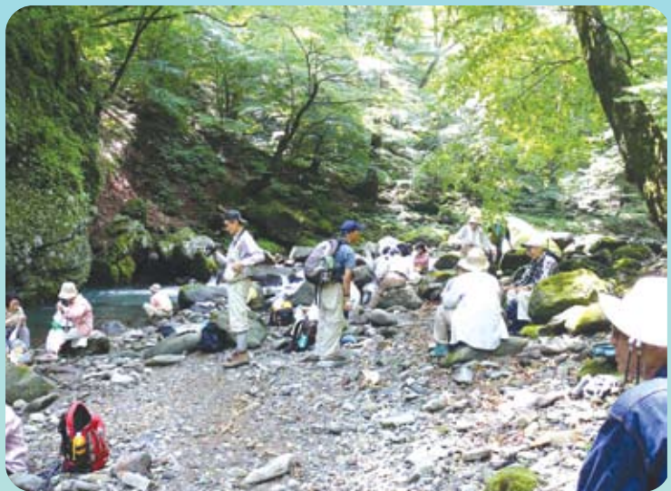
涼風ウォーク（那須塩原市）本文P.4

四季折々の豊かな自然と美味しい水や食料の供給源であり、洪水などを防いでくれます。