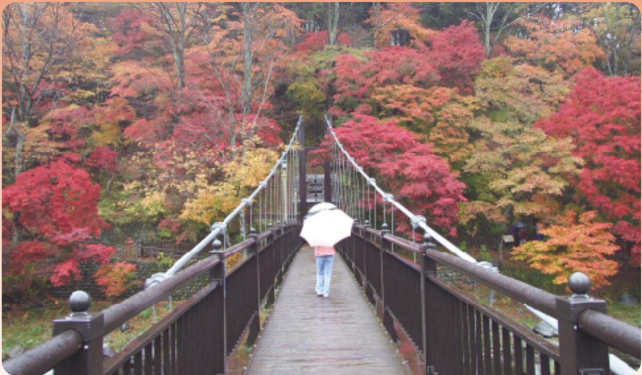
「紅の吊橋」(那須塩原市)