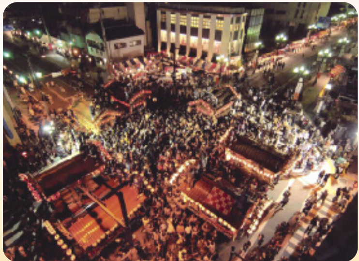
鹿沼ぶっつけ秋祭り(鹿沼市) 本文P.5

四季折々の豊かな自然と美味しい水や食料の供給源であり、洪水などを防いでくれます。