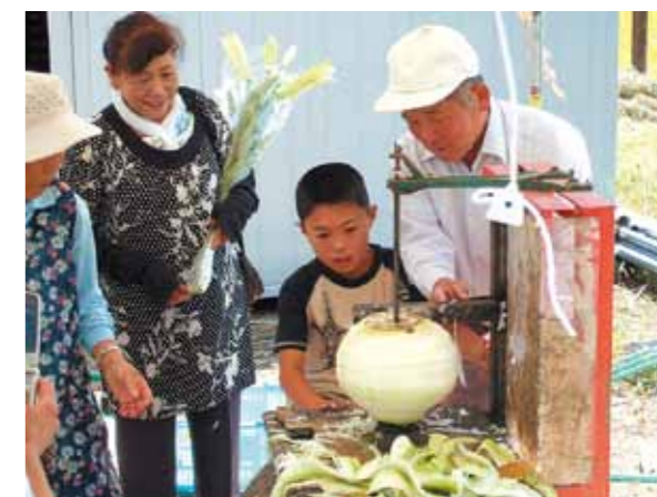
かんぴょうむき体験