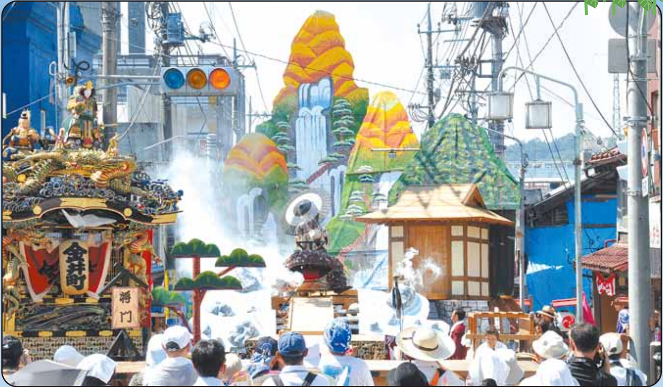
山あげ祭(那須烏山市)本文P.9