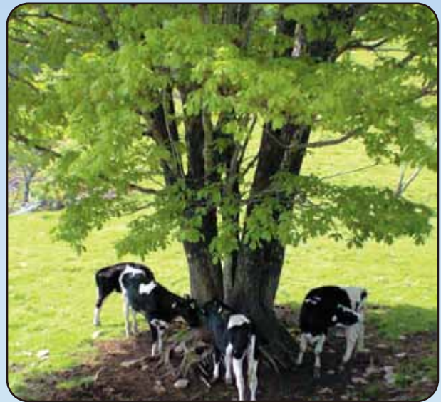
横根高原(鹿沼市)本文P.9

四季折々の豊かな自然と美味しい水や食料の供給源であり、洪水などを防いでくれます。