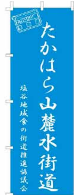
このぼり旗が目印★