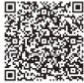
モバイルサイトQRコード