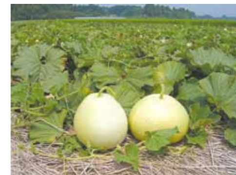
かんぴょうの素になる「ゆうがお」畑

http://agrinet.pref.tochigi.lg.jp/tochigi_event/event.cgi?rm=road_event&road_code=10