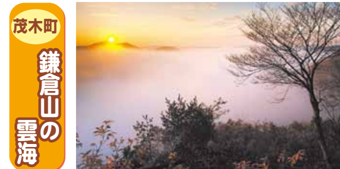
茂木町 鎌倉山の雲海

場所／屋台のまち中央公園 お問合せ／鹿沼市観光物産協会 TEL 0289-60-6070