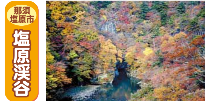
那須塩原市 塩原溪谷

自然が豊かな中山間地域の紅葉は、まさに必見の一言！ 作り物ではない、天然のアート作品をとことん堪能して、心を豊かにしてほしい！