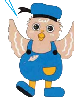
矢板市マスコットキャラ ポッポちゃん

矢板市のURLは http://www.city.yaita.tochigi.jp/ ぜひチェックしてね!