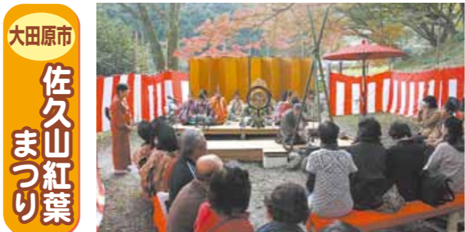
大田原市 佐久山紅葉まつり

鎌倉山の雲海 問い合わせ先／茂木町地域振興課 0285-63-5644 そばの里まぎの お問合せ／そばの里まぎの 0285-62-0333（水曜定休）