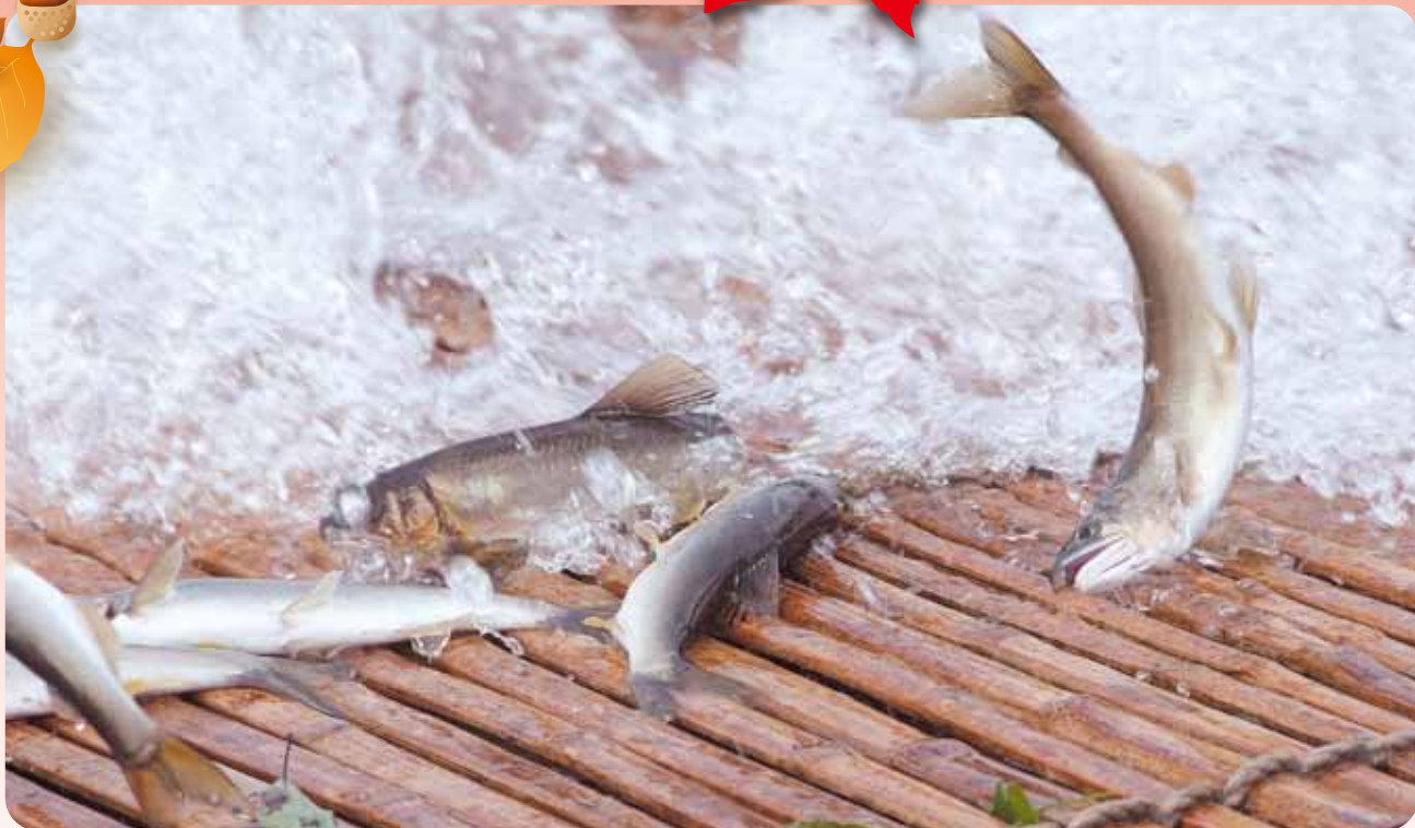
P3.やな架設(大田原市内)