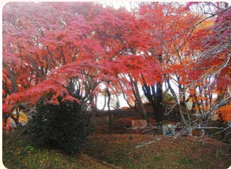
P3.御殿山公園の紅葉(大田原市)