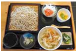
そばセット(ミニかき揚げ丼) 1,300円

道の駅湧水の郷しおや内に店を構える～そば処「かみざくら」～。店内では職人が地元そば粉と湧水の郷ならではの名水を使って仕込んだそばを楽しむことができます。そばは風味のある「田舎そば」と、石臼挽きの「湧水そば」の2種類。それぞれコシがあり香りが高く、さわやかな喉越しです。地場産の野菜を使った天ぷらもさくさくで季節の風味を味わえます。ぜひ一度お試しください! 営業時間/午前11時～午後3時(冬期間は、閉店時間が異なります) 休業日/毎月第1・第3火曜日、年末年始 住所/栃木県塩谷郡塩谷町大字船生3733-1 道の駅湧水の郷しおや内 交通ガイド/東北自動車道「矢板IC」から国道4号, 国道461号で日光方面に約20km 問い合わせ/そば処 かみざくら TEL 0287-47-2551 道の駅湧水の郷しおや TEL 0287-41-6101 URL https://www.town.shioya.tochigi.jp/forms/info/info.aspx?info_id=25857