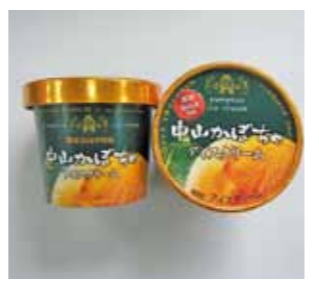
中山かぼちゃアイスクリーム (250円～300円(税込))

営業時間／①午前9時～午後4時 ②午前9時～午後4時 ③午前8時30分～午後6時30分 定休日／①火曜日 ②火曜日 ③無休 問い合わせ／①TEL 0287-84-1977 ②TEL 0287-83-2765 ③TEL 0287-88-8585