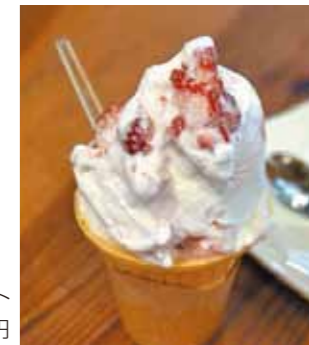
なつおとめジェラート 400円