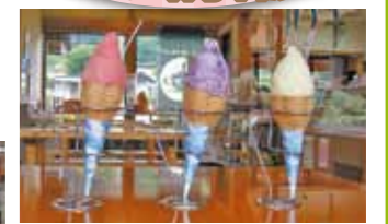
那珂川町産のゆずを使ったゆずシャーベット、ブルーベリーアイス、とちおとめシャーベット(シングル300円、ダブル350円)