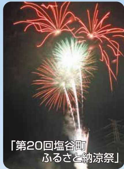
「第20回塩谷町ふるさと納涼祭」