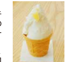
りんご(矢板市産のりんごを使用)、酒粕(森戸酒造の酒粕使用)