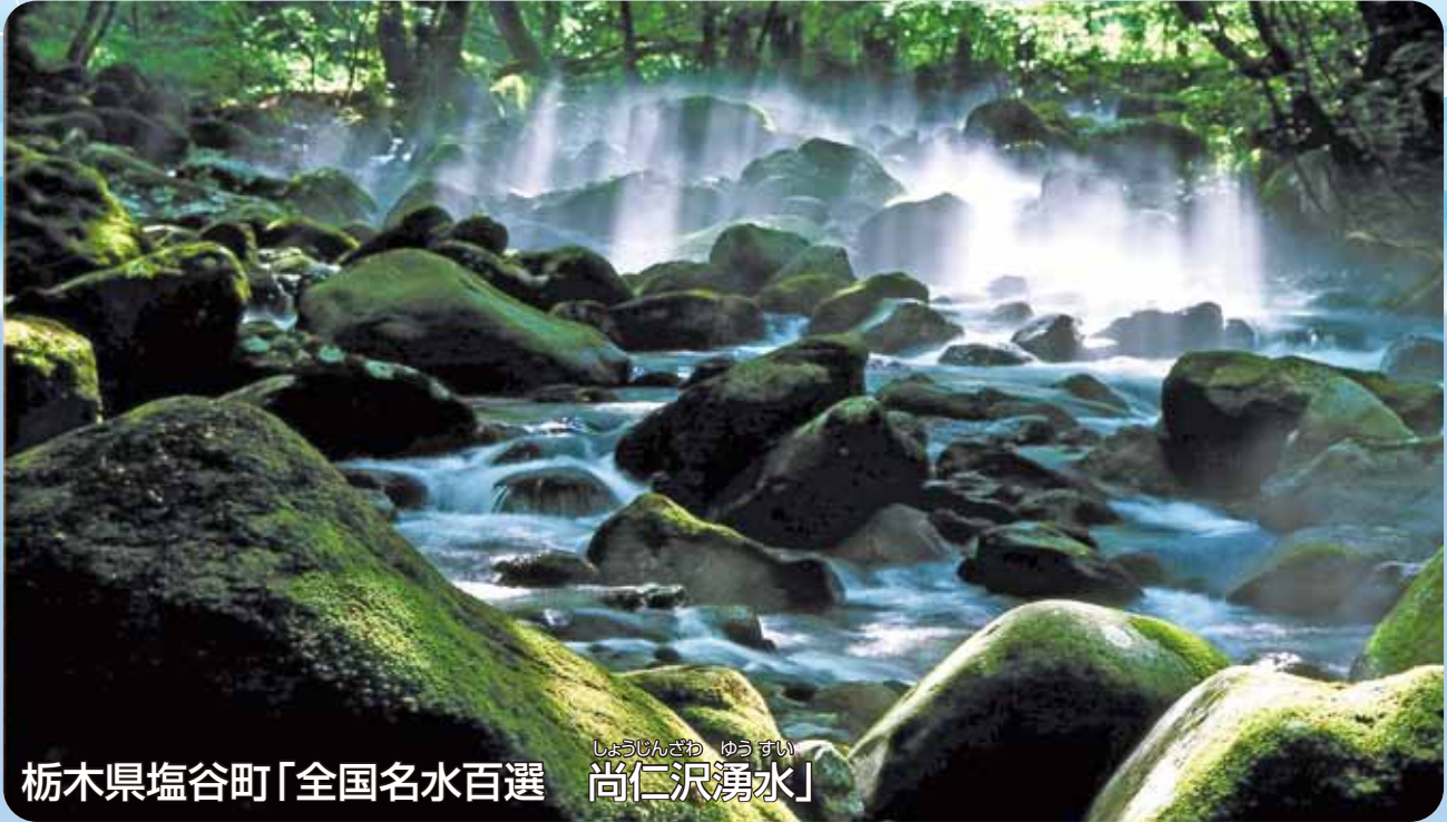
栃木県塩谷町「全国名水百選 尚仁沢湧水」

栃木県の名水「尚仁沢湧水(しょうじんざわゆうすい)」。四季を通じて水温が11℃前後で濃厚な植物の息づかいに包まれた森に走る水面はまるで、水あめを流したかのような彩りです。