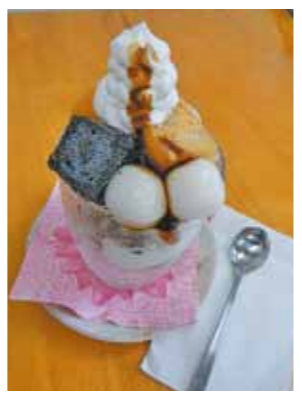
和風ミニパフェ(塩あずきあいす・抹茶あいす)(各380円)

営業時間／午前11時～午後4時 定休日／毎週水曜日 場 所／塩谷町大字船生3733-1 問い合わせ／実のり食堂 TEL 0287-47-1215