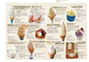
アイスクリーム ジェラートマップ

営業時間・定休日／(各店舗による) 場 所／那須町内 問い合わせ／那須町観光協会 TEL 0287-76-2619